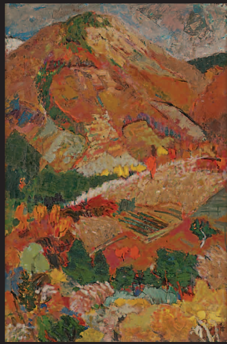
蔵王秋色 1971 第3回日展