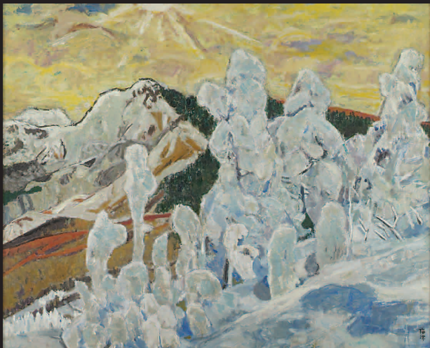
樹氷(蔵王) 1991 第23回日展