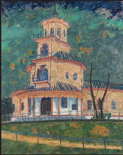
旧済生館 1987 第53回東光展