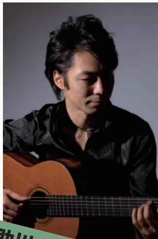
助川太郎 ギタリスト