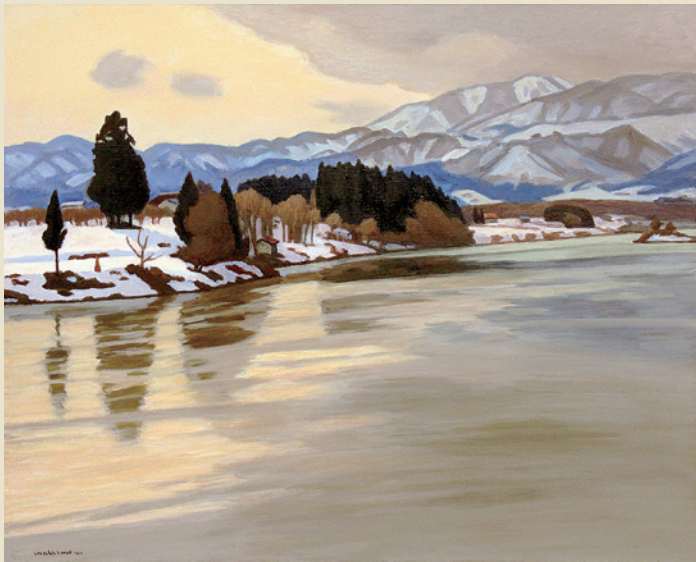
真下慶治 「浅春最上川」 1990 F100 日展改組22回 村山市大淀